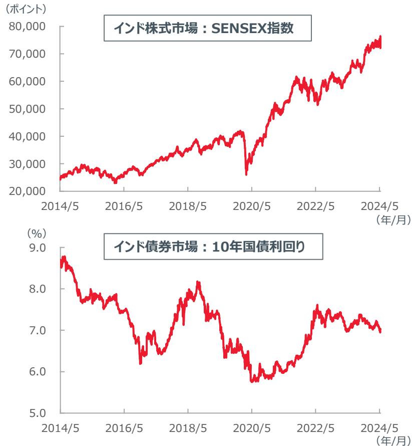
【図表2: 金融市場の動き (2014年5月26日～2024年6月5日)】