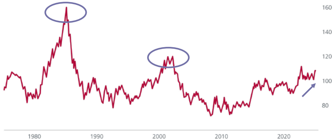
図表 1: 米ドル指数の推移